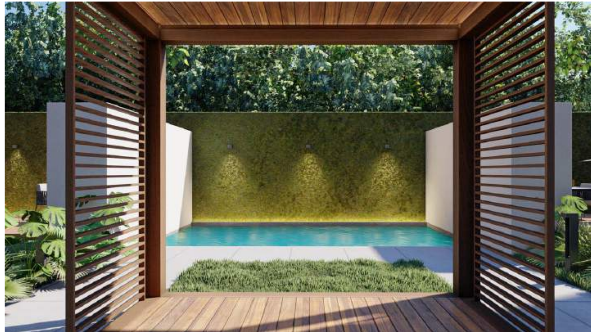
GAZEBOS Y PISCINAS