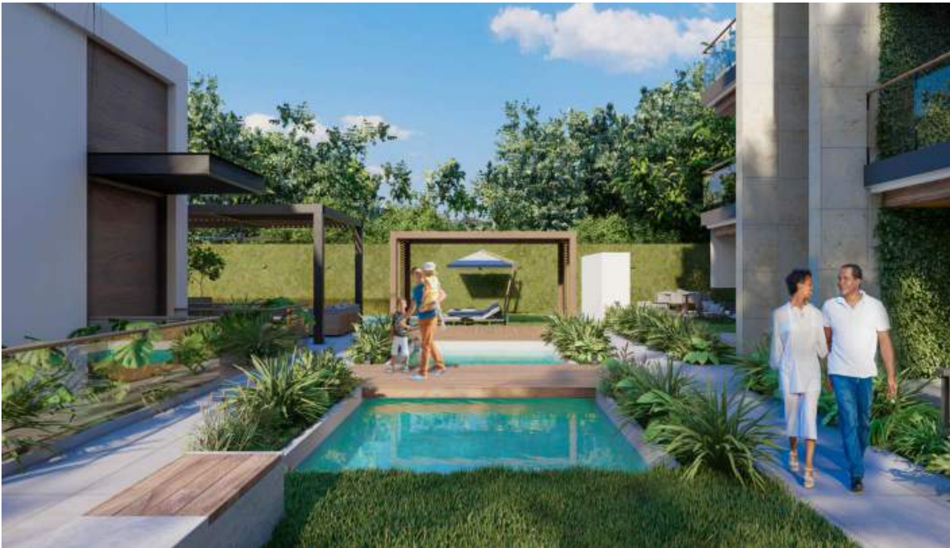
ESPEJOS DE AGUA