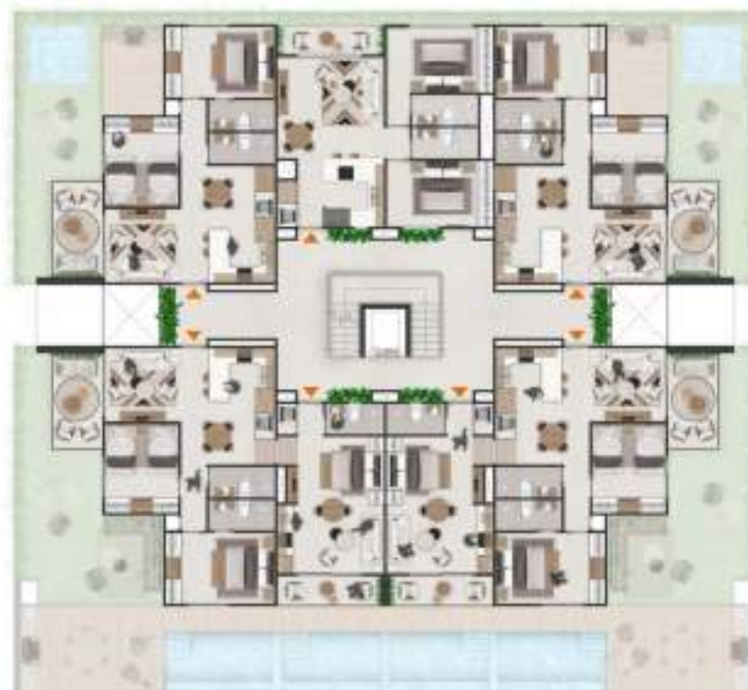
NIVELES 2 Y 3