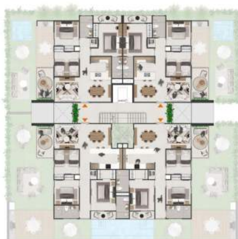
NIVELES 2 Y 3